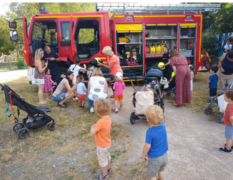
La visite des pompiers