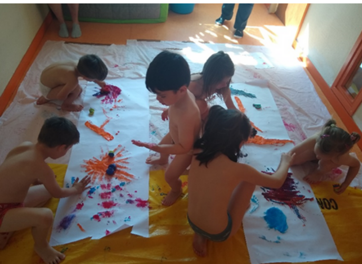
Des ateliers de peinture libre