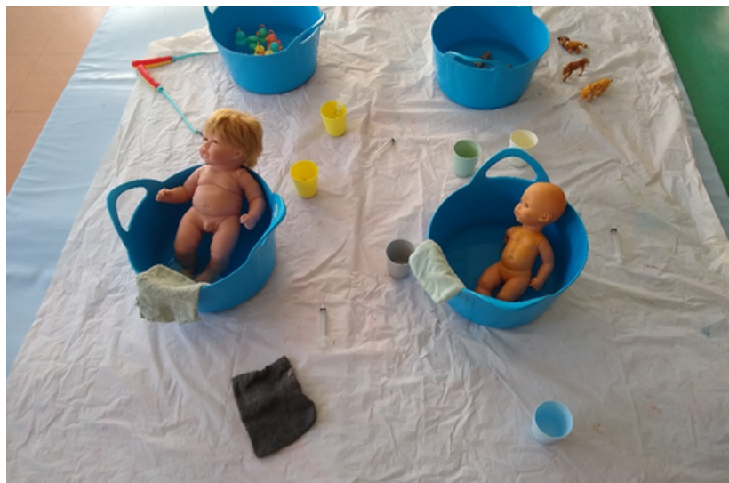
Des jeux d'eau